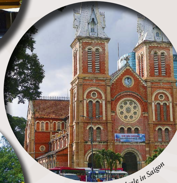
Kathedrale in Saigon