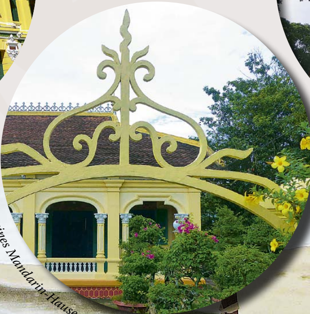
Außensicht eines Mandarin-Hauses im Mekong-Delta