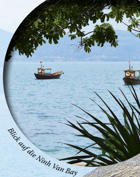
Blick auf die Ninh Van Bay