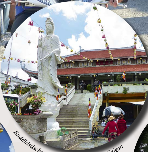
Buddhistischer Tempel Vinh Nghiem in Saigon