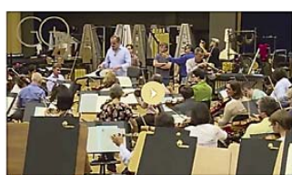
"Making of" Pierre Boulez "Notations"