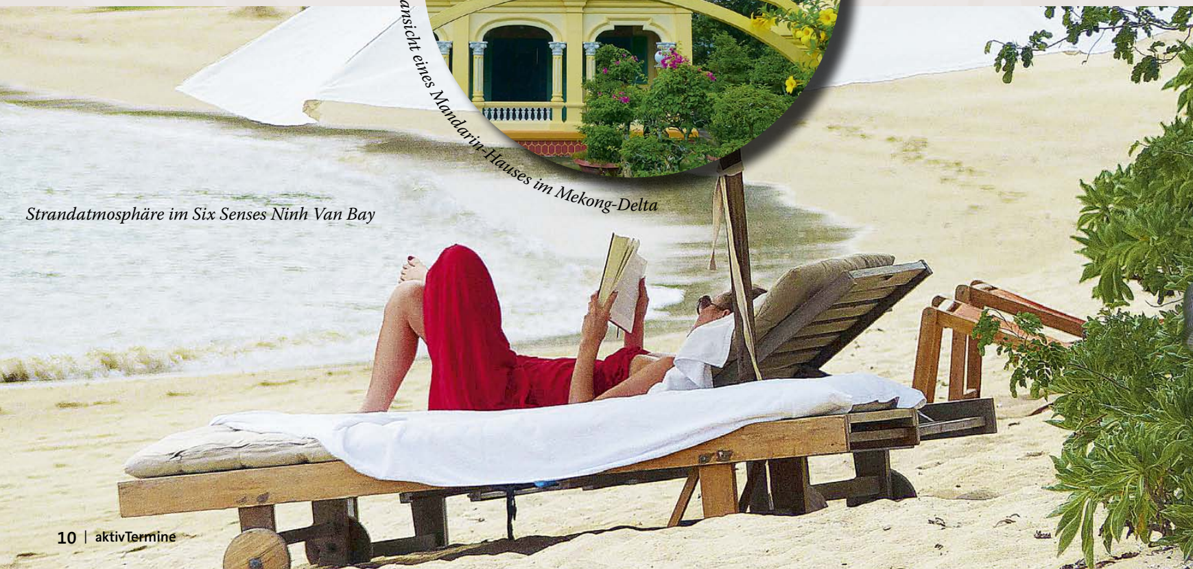
Strandatmosphäre im Six Senses Ninh Van Bay