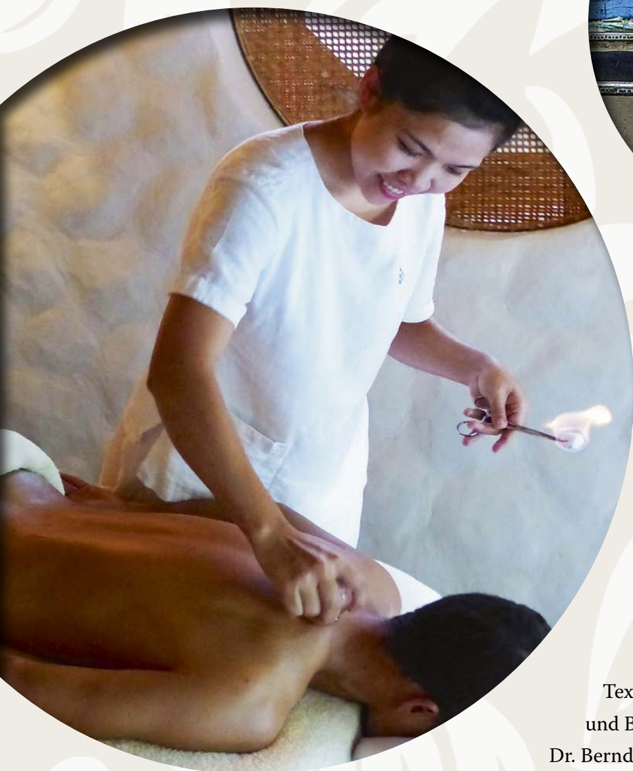
Massage im Six Senses Ninh Van Bay

Und dies inmitten eines überaus fruchtbaren Schwemmland, in dem versehentlich vergessene Holzstühle angeblich bereits über Nacht Wurzeln schlagen. Von dieser Üppigkeit zeugen die schwimmenden Märkte, auf denen in aller Herrgottsfrühe von wendigen Booten aus Früchte und Gemüsesorten verschiedenster Art den Besitzer wechseln. Asien in seiner wohl buntesten und vielleicht attraktivsten Form.