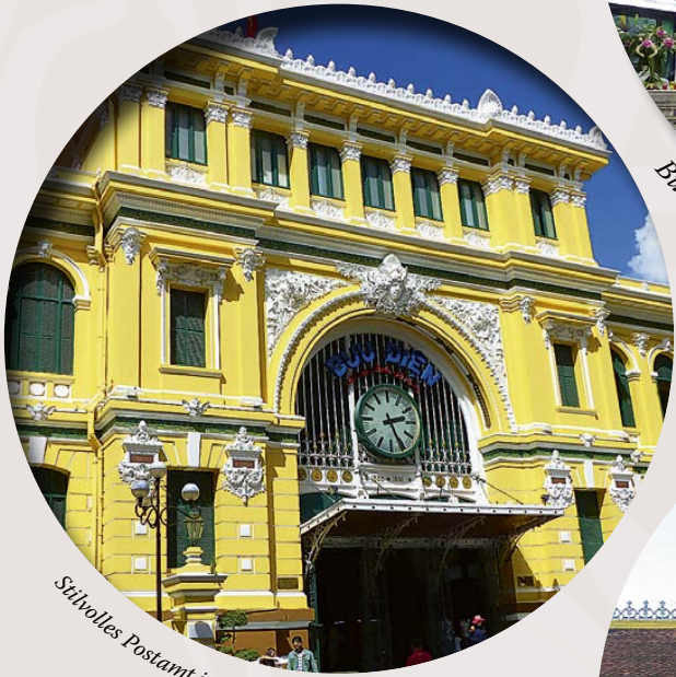
Stilvolles Postamt in Saigon