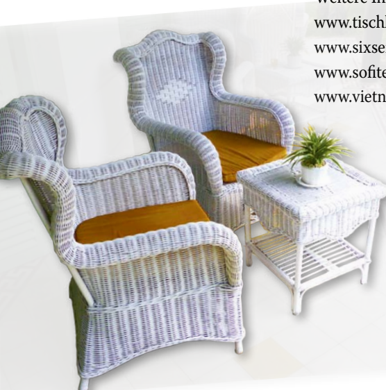
Sitzgruppe in Le Longanier im Mekong-Delta

Weitere Informationen: www.tischler-reisen.de www.sixsenses.com www.sofitel.com www.vietnamairlines.com