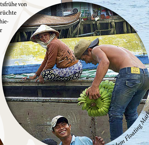
Umladen von Bananen auf dem Floating Market von Cai Be