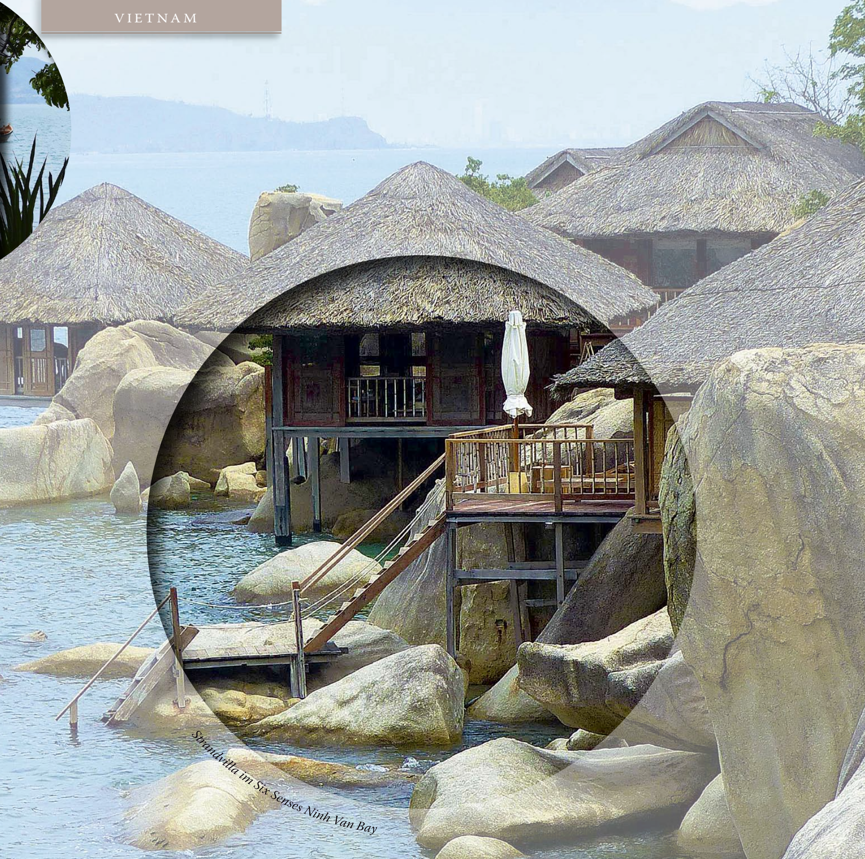
Strandvilla im Six Senses Ninh Van Bay