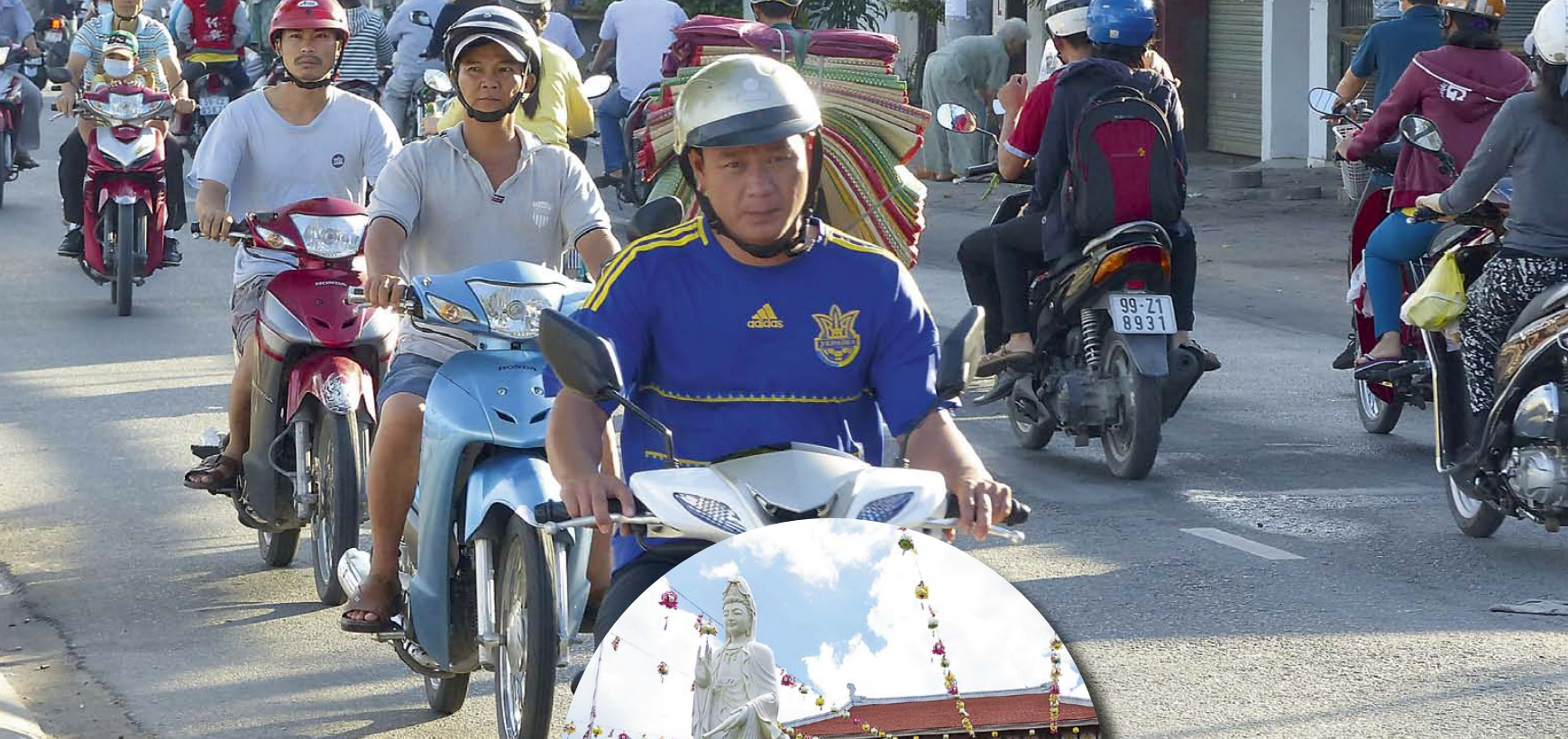
Berufsverkehr auf den Straßen von Saigon